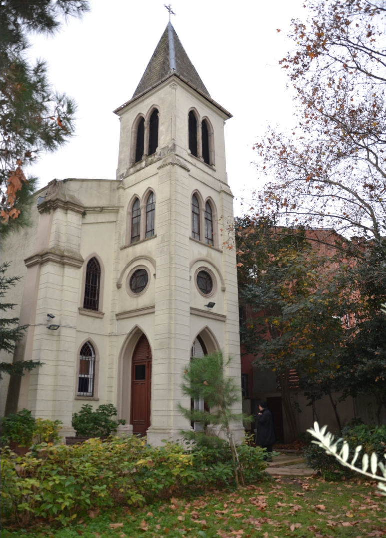
ნმ. მარიამის სახ. ბერძნული მართლმადიდებლური ეკლესია