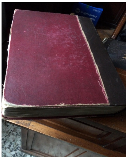
გარდაცვლილთა დავთარი – „სულთა მატჩანე“