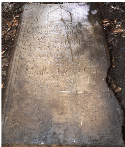
სტამბოლის ქართველ კათოლიკეთა სავანის ეზოში დაცული საფლავის ქვა