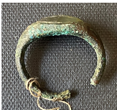
სურ. 3, 3ა.