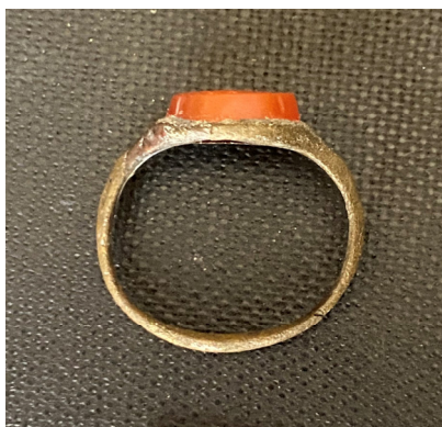
სურ. 5, 5ა.