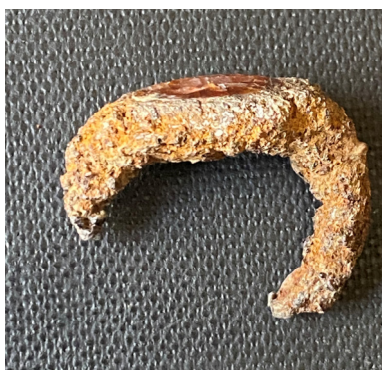
სურ. 2, 2ა.