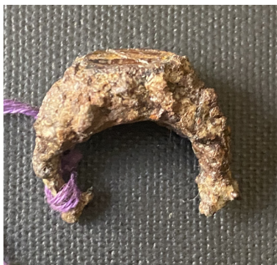
სურ. 8, 8ა.